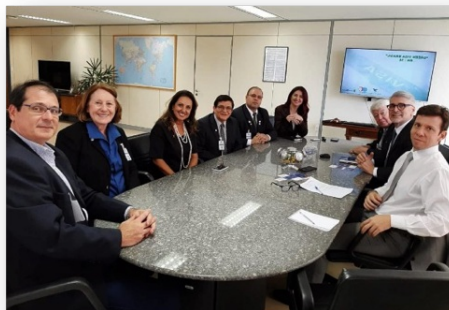
Reunião com membros do Conselho Nacional de Imigração/MJ, na sede da Secretária Nacional de Justiça