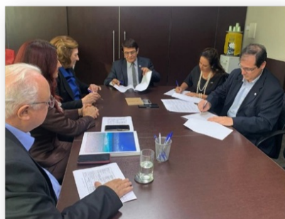
Assinatura do acordo de parceria entre CMI/Secovi-MG e Sistema Cofeci Creci para ações em prol da RN 36

SERVIÇO PÚBLICO FEDERAL CONSELHO FEDERAL DE CORRETORES DE IMÓVEIS - COFECI Edital de Chamada Pública nº 002/2018 CONVÊNIO PARA CONCESSÃO DE APOIO INSTITUCIONAL PARA CRIAÇÃO E IMPLANTAÇÃO DE MELHORIAS EM ANÚNCIOS IMOBILIÁRIOS POR MEIO DE PLATAFORMA DIGITAL Solução digital que contribuirá para a conectividade do mercado imobiliário nacional com o internacional, com ações que elevarão o padrão de qualidade dos serviços prestados pelos corretores de imóveis brasileiros